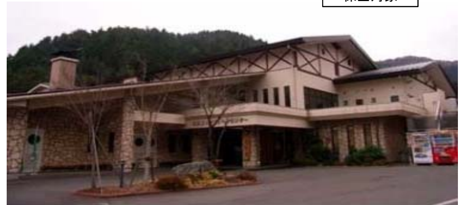
町営グリーンセンター (避難所)