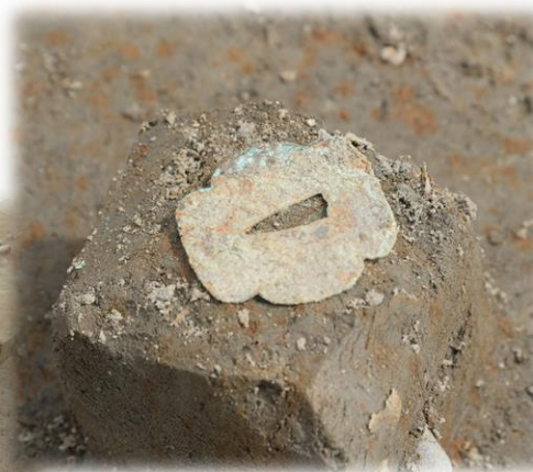
現場から発見された 刀の鐔、子供用の下駄、石列