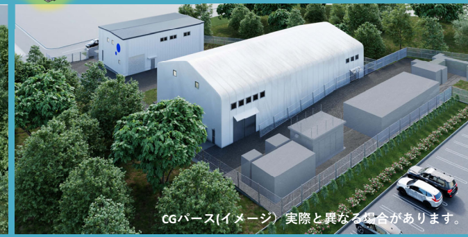
CGパース(イメージ) 実際と異なる場合があります。