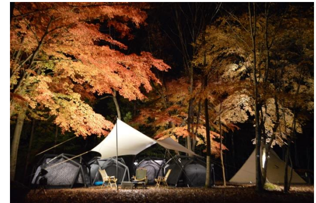
自然に囲まれたキャンプ