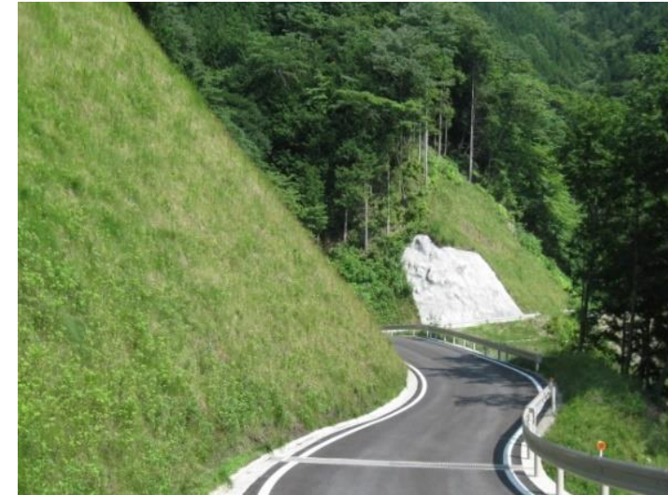
④ 法面保護工の状況