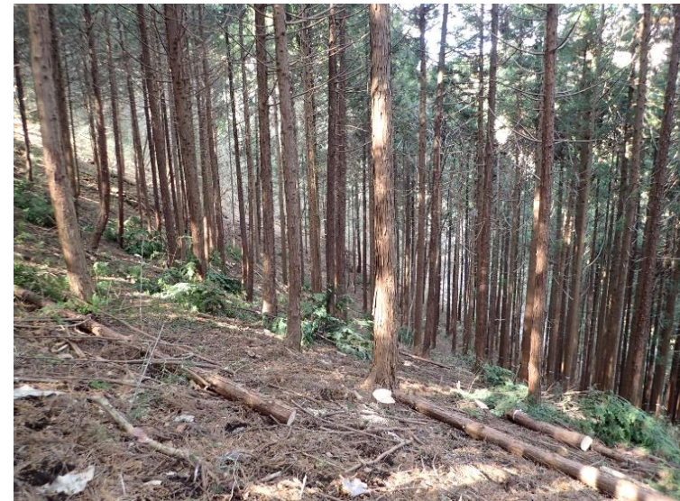
② 林道沿線における森林整備の状況（実施後）