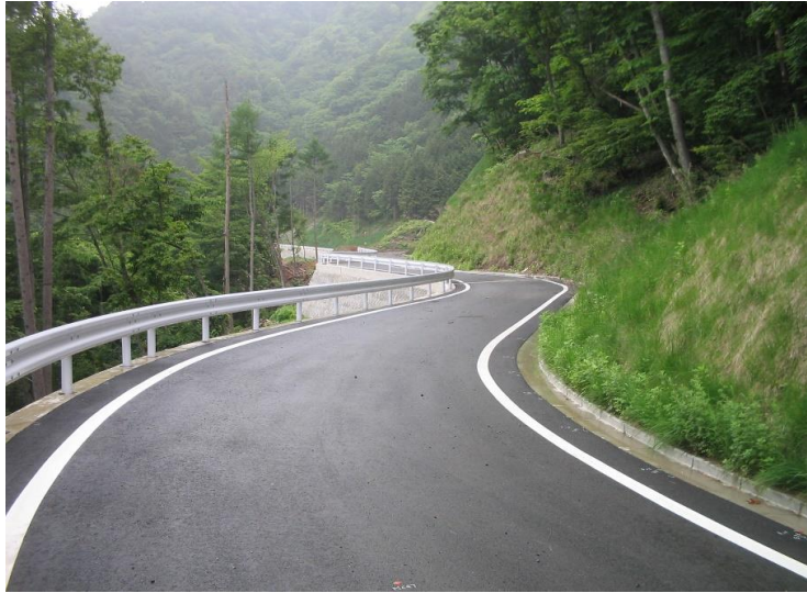
① 完成済区間の状況