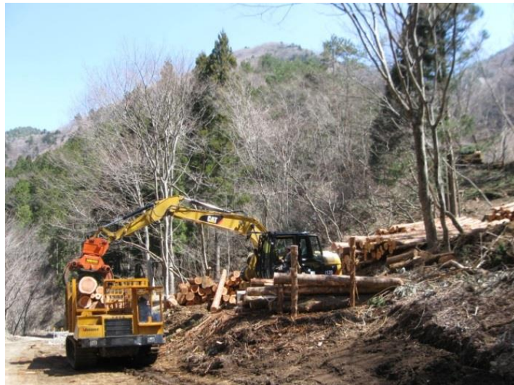
③ 林道沿線における木材の搬出状況