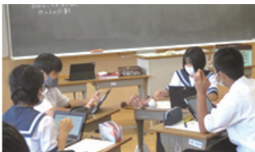
学園祭でのお互いの姿を伝え、自分のよさを考える。