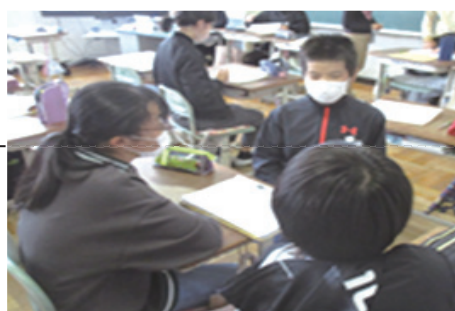
議題の決め方についても話し合う。

本事例では議題の選定・決定自体を学級会の目的としている。議題の選定・決定を学級会にて全員で行うことで、学級の問題をより自分事として考えるようにしている。