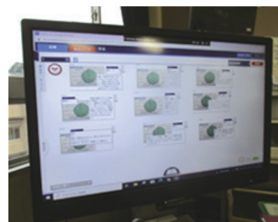
各自の意見を大型モニターに表示し、比較する。

学習支援ソフトを活用し、児童一人一人の議題についての意見を集約、比較、分類する。また1人1台端末は過去のレーダーチャート等のデータ資料を利用しやすく、自分や学級の成長や変化を振り返る時にも有効である。