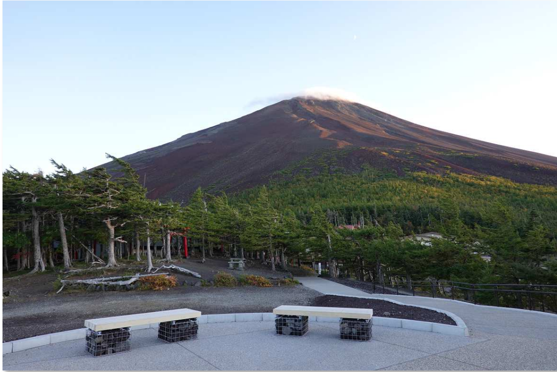
富士山が雄大に見えます！