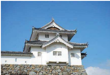
稲荷櫓 （稲荷曲輪・数寄屋曲輪地区）