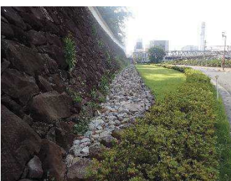
稲荷曲輪石垣（北側）