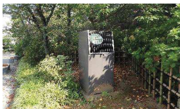
ライトアップ用照明