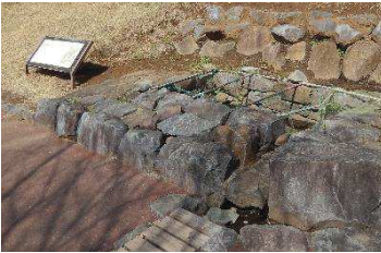
石組遺構（鍛冶曲輪地区）