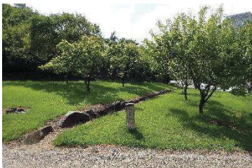
梅林（稲荷曲輪・数寄屋曲輪地区）