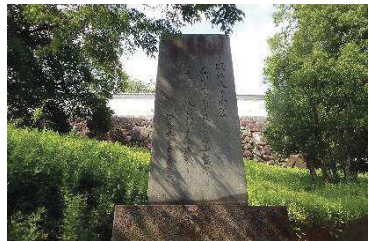
明治天皇御製碑（鍛冶曲輪地区）