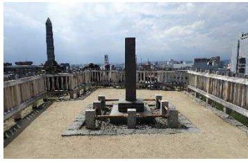
明治天皇御登臨之趾（本丸地区）