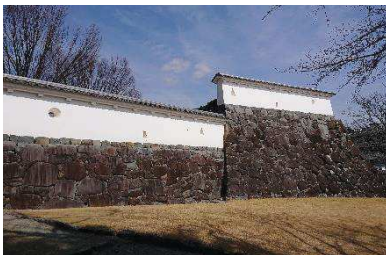
修景施設・漆喰塀 （稲荷曲輪・数寄屋曲輪地区）