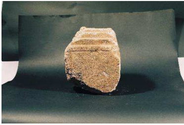
石造物（石垣中・二の丸地区）