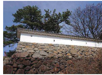
修景施設・漆喰塀（二の丸地区）