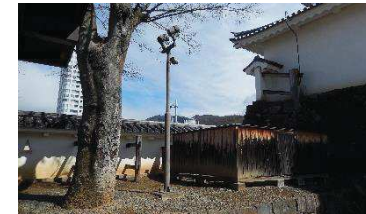
ライトアップ用照明