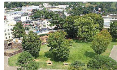
マツ等（稲荷曲輪・数寄屋曲輪地区）