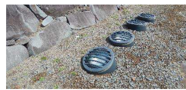
ライトアップ用照明