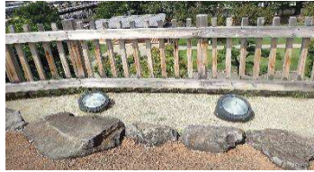
ライトアップ用照明