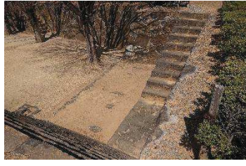
礎石（稲荷曲輪・数寄屋曲輪地区）