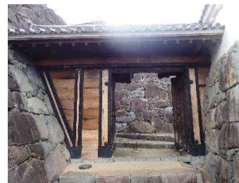
稲荷曲輪門 （稲荷曲輪・数寄屋曲輪地区）