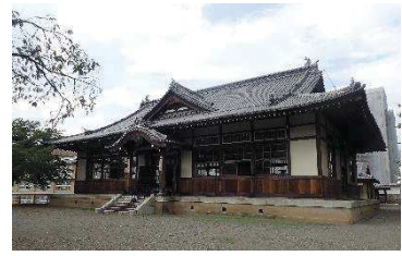
武徳殿（二の丸地区）