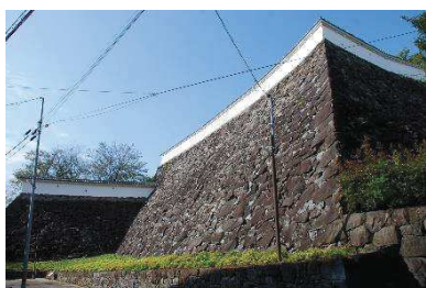
稲荷曲輪石垣（東側）