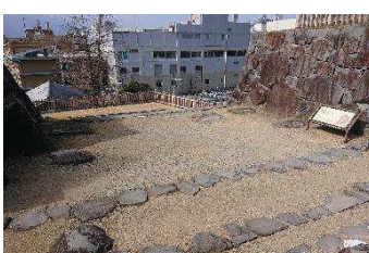
銅門礎石（本丸地区）