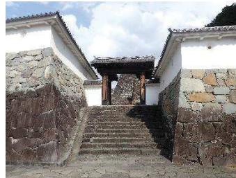
内松陰門（二の丸地区）