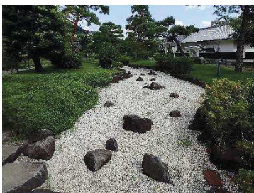
日本庭園（鍛冶曲輪地区）