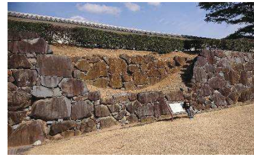
二重石垣（稲荷曲輪・数寄屋曲輪地区）