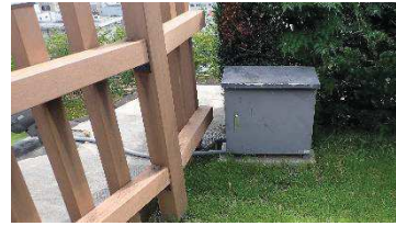
ライトアップ用照明電源盤