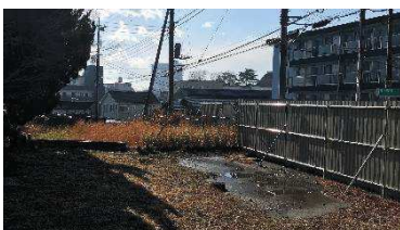
進入防止フェンス