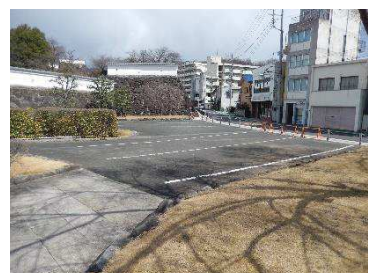
駐車場（堀地区（指定地内））