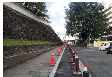
数寄屋曲輪石垣（東側）