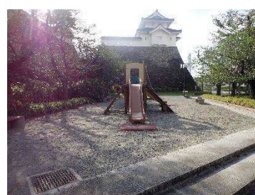
あじさい公園（堀地区（指定地内））