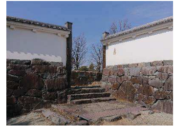
数寄屋勝手門 （稲荷曲輪・数寄屋曲輪地区）