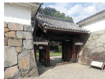
鍛冶曲輪門 （鍛冶曲輪地区）