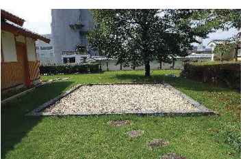
硝煙蔵（稲荷曲輪・数寄屋曲輪地区）