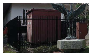
屋外キュービクル