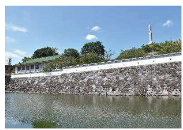
修景施設・漆喰塀 （鍛冶曲輪地区）