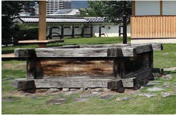
井戸（稲荷曲輪・数寄屋曲輪地区）