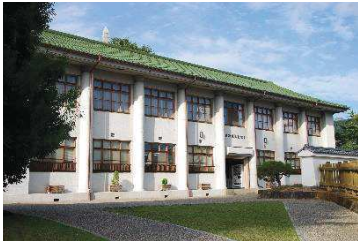
恩賜林記念館（鍛冶曲輪地区）