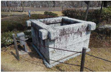
井戸（鍛冶曲輪地区）