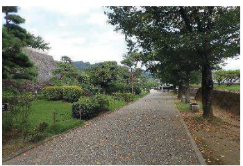
サクラ、マツ等（鍛冶曲輪地区）