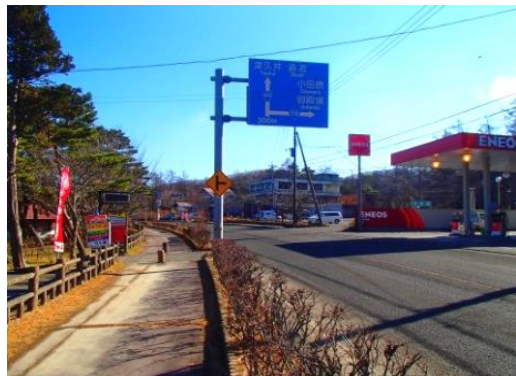
①国道413号(第1次緊急輸送道路)