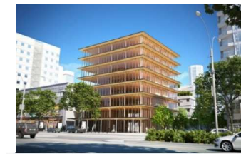
「都市木造CG/ NPO法人 team Timberize」