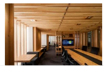
株式会社イトーキ Tokyo innovation center SYNQA