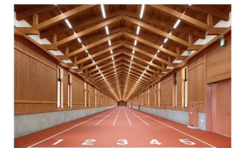
富士ウッドストレート

県産材利用促進会議 ・ 副知事をトップに庁内関係部局により構成する県産材利用促進会議において木材の円滑な利用の促進に関する検討を行う 市町村との連携 ・ 市町村施設における積極的な利用を働きかけるとともに技術的な助言などを行う