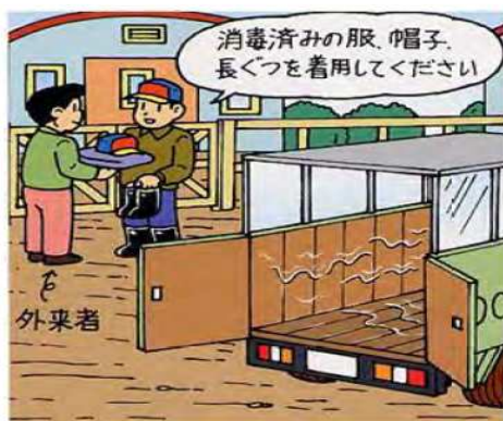
豚舎ごとの専用長靴