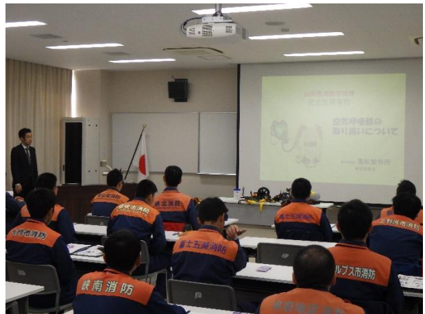
空気呼吸器説明（重松製作所）