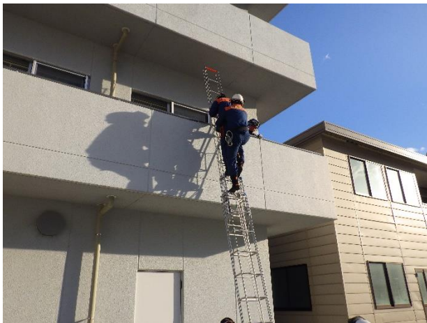
三連梯子取扱い訓練