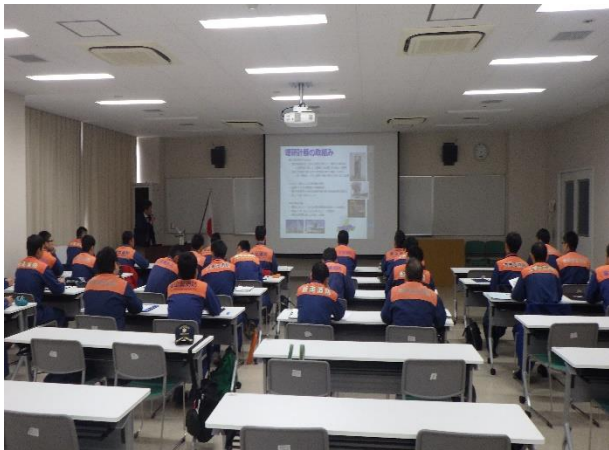
ガス検知器説明（理研計器）