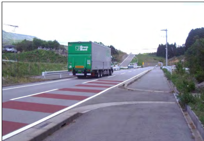
① 広域農道の全線開通により、主要道路とのアクセスが向上し、輸送の合理化が図られた。