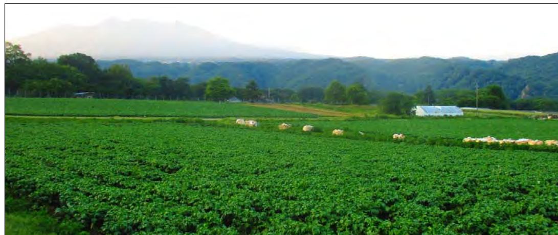
② 広域農道の沿線では、近隣の耕作放棄地が解消され営農団地が形成されている。