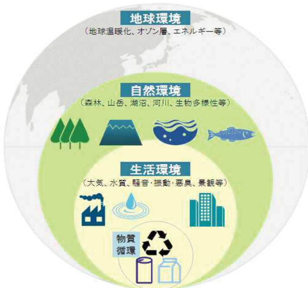
<図1-2 計画が対象とする環境>