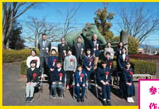
▲2月26日【日】表彰式・受賞者集合写真 ※当初2月11日開催予定でしたが大雪のため延期となりました。