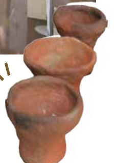
第17回受賞者製作土器