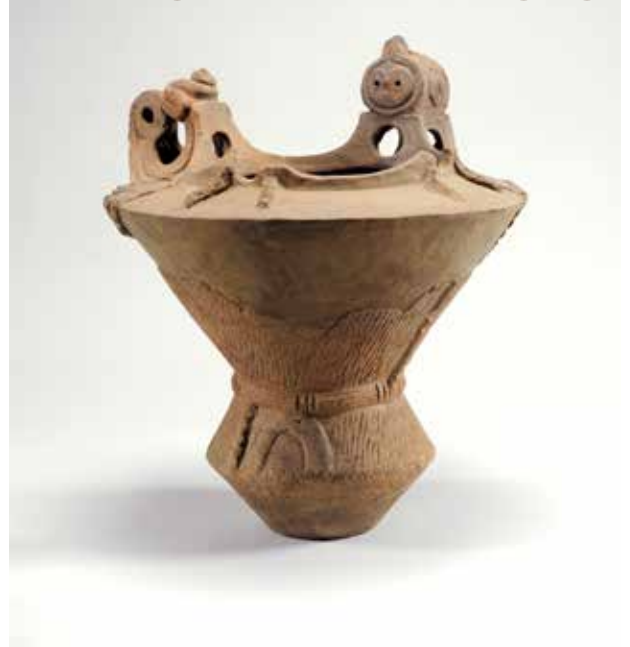
重要文化財 深鉢形土器 一の沢遺跡

本展では、世界的に見ても珍しい装飾をもつ縄文土器 から読み取れる8つの物語を紹介します。