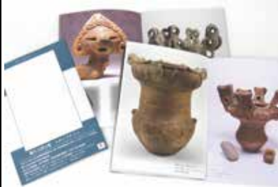
▲山梨が誇る縄文の遺物をたっぷり掲載！