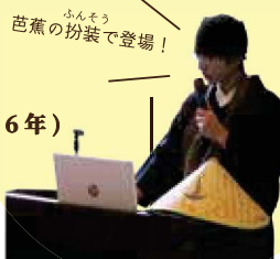
芭蕉の扮装で登場！