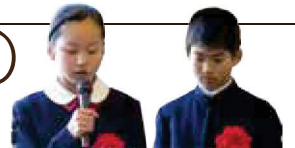
団体最優秀賞 駿台甲府小学校6学年