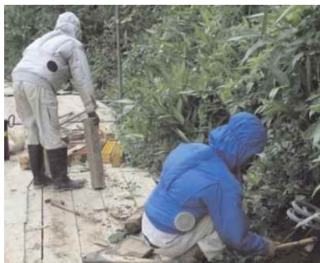
空調機能付きの作業服を活用