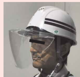
フェイスシールド等の活用