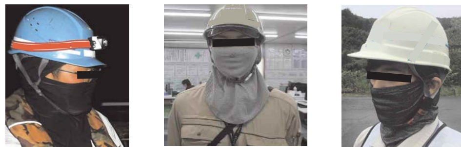
冷感素材のフェイスマスクの活用