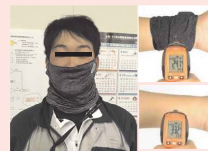
冷感素材のフェイスマスクの活用