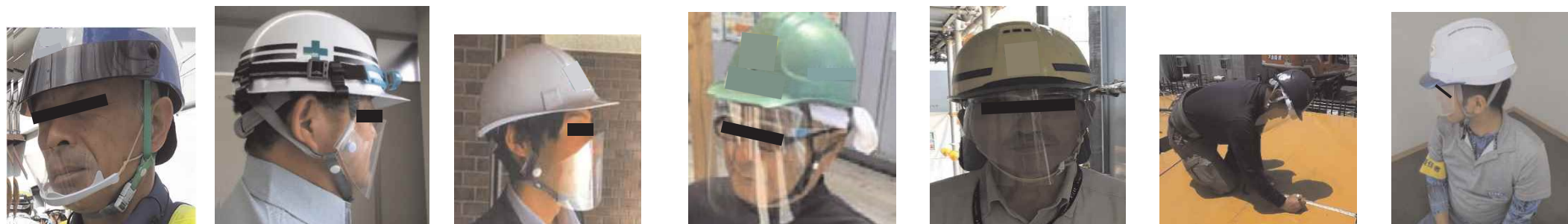
マウスシールドの活用