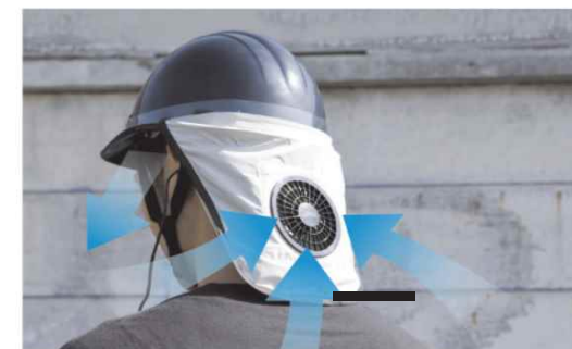
空調ヘルメットの活用