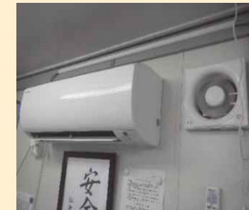
扇風機や換気扇とエアコンを併用