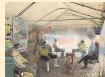
屋外休憩所にドライミスト発生装置等を設置