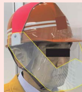
マウスシールド等の活用