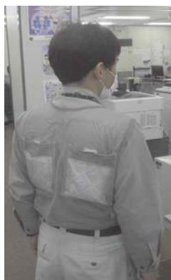
ベストに保冷剤を入れて作業