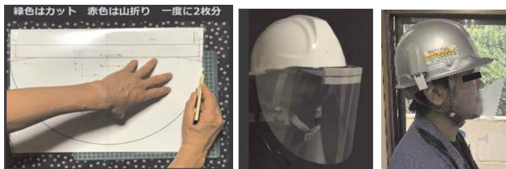
クリアファイル等を利用したフェイスシールド等の作成