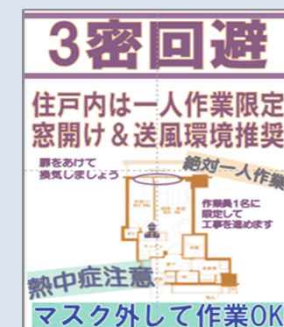
マスクを外してよい条件を設定