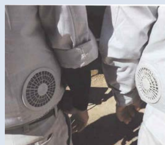
空調機能付きの作業服の活用