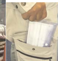
状況に応じてマスクを外せるよう、 携帯用の袋等を活用