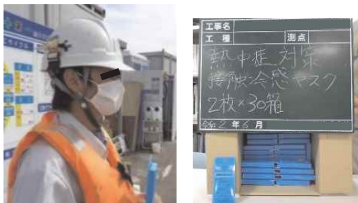
冷感マスクの活用