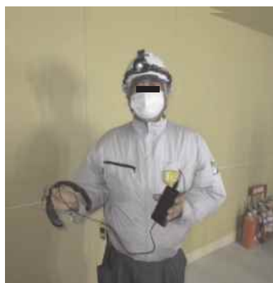
首掛けクーラーの活用