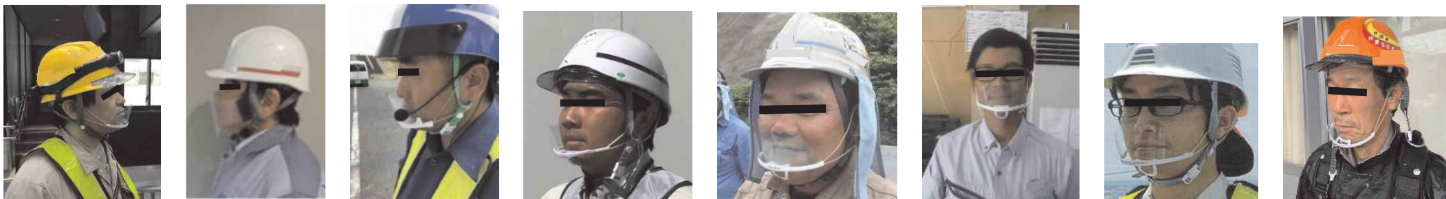
マウスシールドの活用