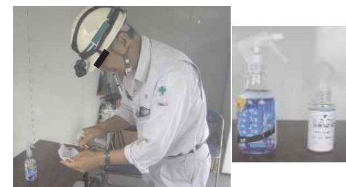
冷感スプレー等の活用