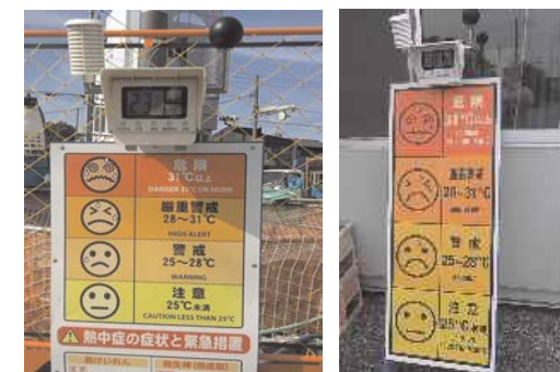
暑さ指数(WBGT)に応じて、 マスクを外しての作業を許可 (例:暑さ指数(WBGT)が21℃以上の場合は外してもよい)