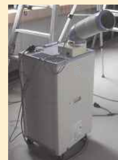
スポットクーラー等の活用