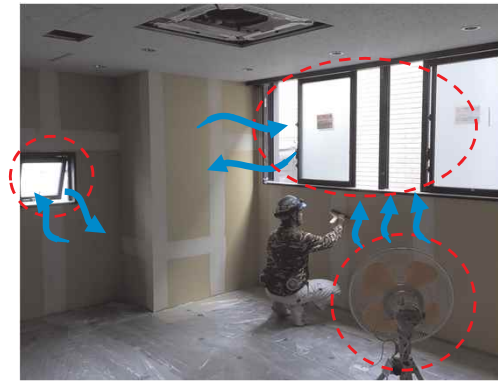
スポットクーラー、扇風機等の活用