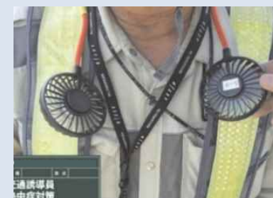
首掛けクーラー等の活用 ※巻き込み等にご注意