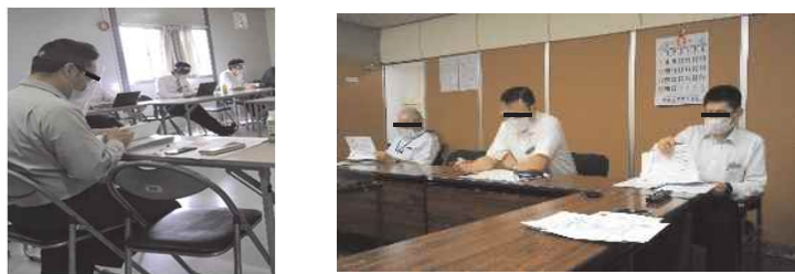
打ち合わせ時における マウスシールド・フェイスシールドの活用