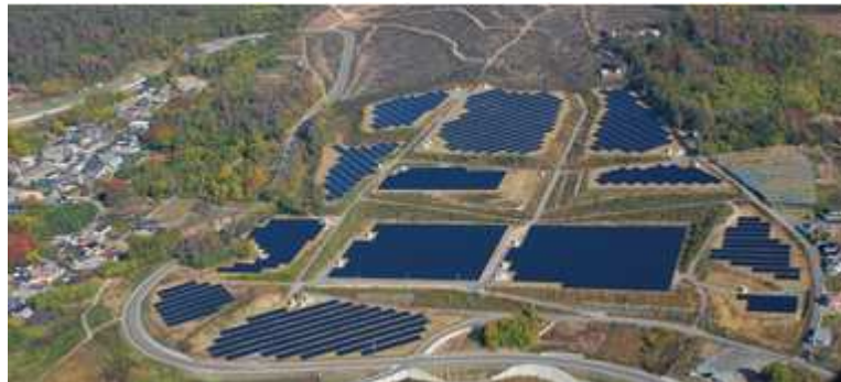
「やまなしメガソーラー(韮崎)」 出力5,266kW(認定出力3,750kW) 平成26年1月運転開始