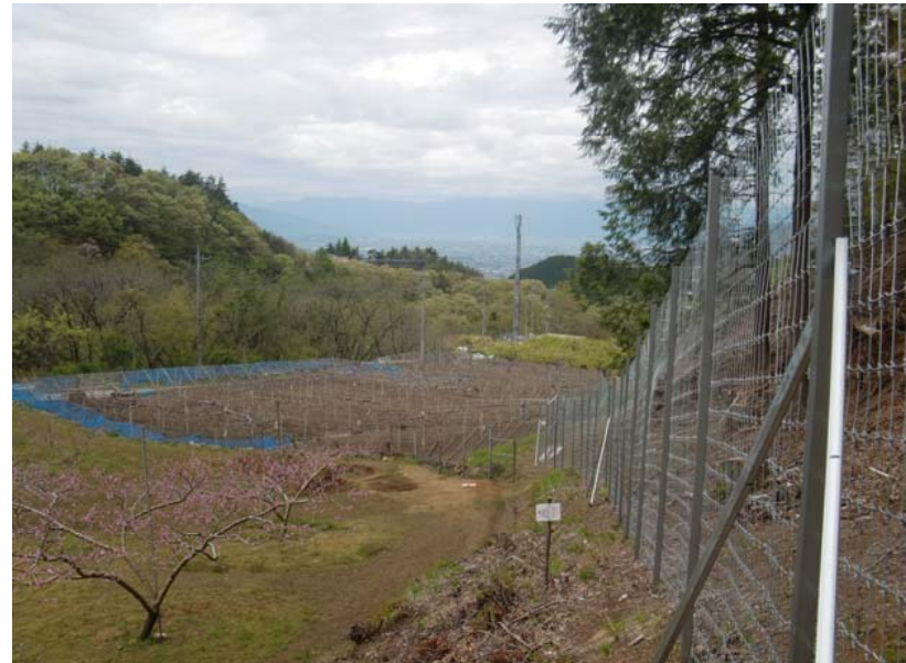
④鳥獣害防止柵の設置例