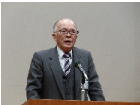
坂本会長あいさつ