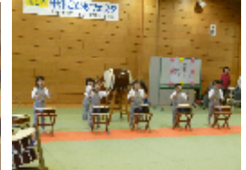
みいづ保育園の和太鼓