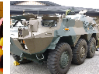
試乗車（装甲車・消防自動車・パトカー他）