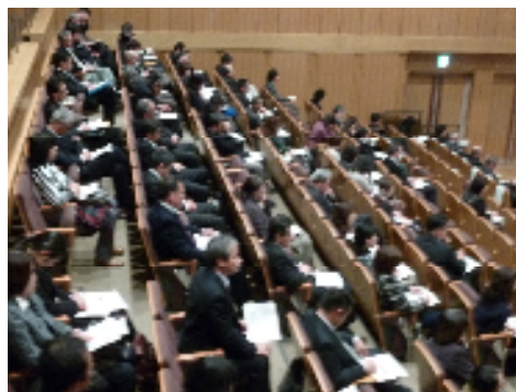
講演に聴き入る参加者