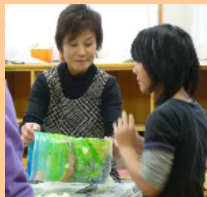
〈ランプシェード鑑賞会〉