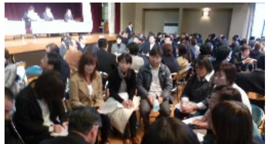
フロアを交えたディスカッションの様子