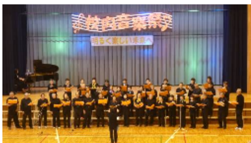
東八代学園・石和西小学校との交流会

また、それぞれの学園において、生徒の部活動や趣味を生かした陶芸・写真・絵手紙・手芸・盆栽などの作品展も開催しました。