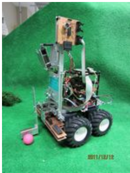
「自律型ゴルフロボット」