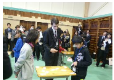
「What subjects do you like?」 （5年生）