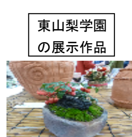
東山梨学園 の展示作品