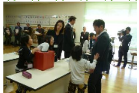
フラックボックスゲーム（3年生）

★岩手小学校ではコミュニケーション能力の育成を目指すと共に、発達段階に応じて「聞くこと」「話すこと」「読むこと」「書くこと」などをバランスよく指導できるよう教育課程を編成しています。山梨市では平成24年度から、山梨北中学校区の4小学校において、英語科学習に取り組めます。