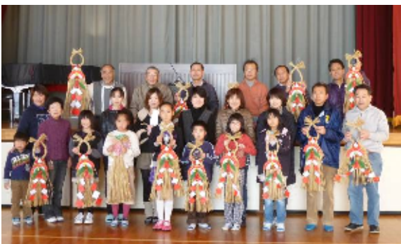
〈完成したしめ縄飾りと一緒に！〉