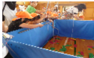
フィッシュランド