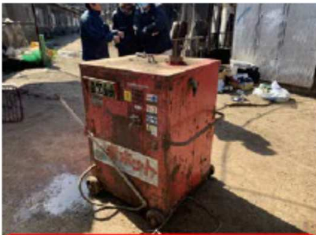
事故発生時はパレット上に、 高圧洗浄機が設置されていた。