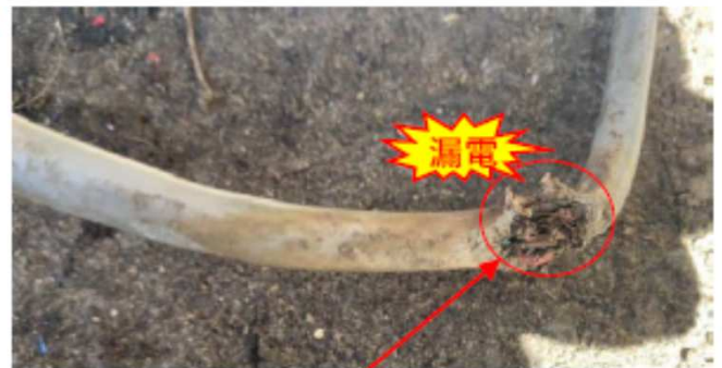
損傷していたキャブタイヤケーブル