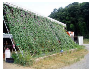
ネットに植物を這わせる