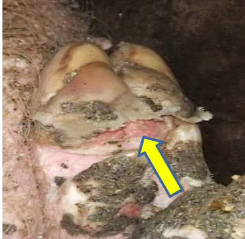
蹄部の水疱の破裂後