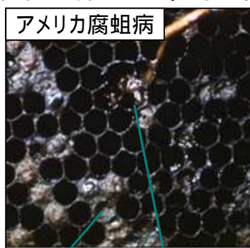
アメリカ腐蛆病 巣房蓋の陥凹、茶褐色腐蛆