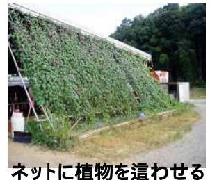
ネットに植物を這わせる