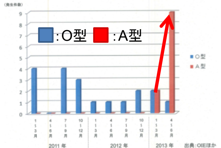
中国における口蹄疫の発生状況(2011年1月以降)