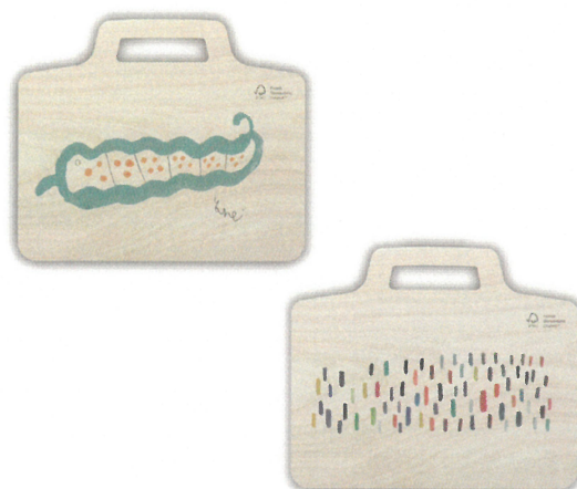
エイブル・アートの例 スキャンした原画をUVプリンターで色鮮やかに印刷