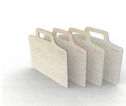
蛍光色での木口の塗装 反り止めの塗装が外観上のアクセントに