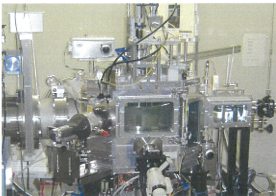
図1 酸化亜鉛成膜装置の写