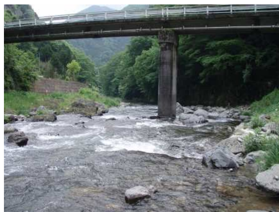
図 2 調査地点（下保之瀬橋）

及び、K. Krammer & H. Lange-Bertalot. 6-8) に基づき同定した。