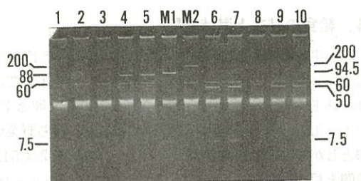
図2 各種PT, 薬剤耐性型とプラスミドファイル

lane 1, 3~12 : SA・SM・TC・ABPC 耐性 60, 50, 7.5 kb lane 2 : SM・TC・ABPC 耐性, 60, 50 kb M 1 : E. coli NR1 M 2 : Salmonella L156