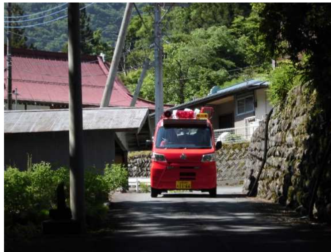
消防団による集落内巡回