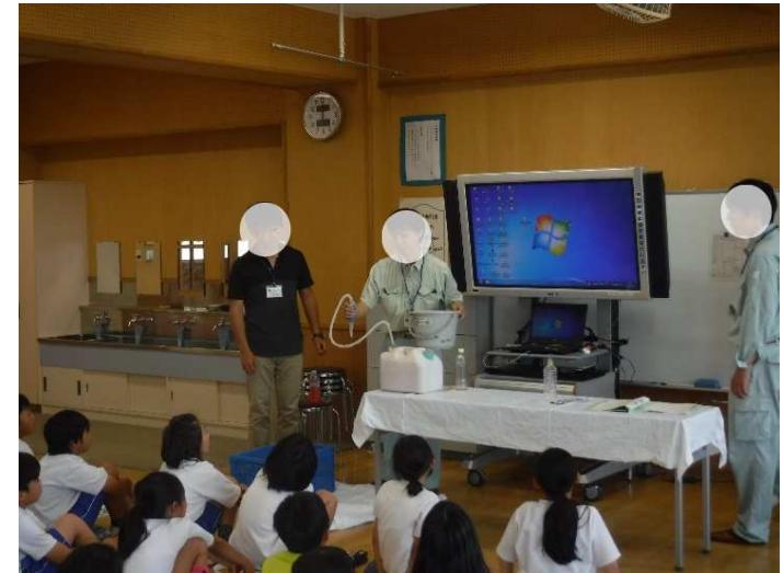
6月14日 中北建設事務所実施状況