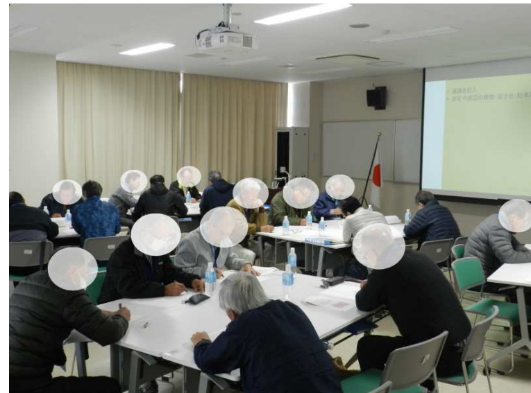
実際にマップを作成