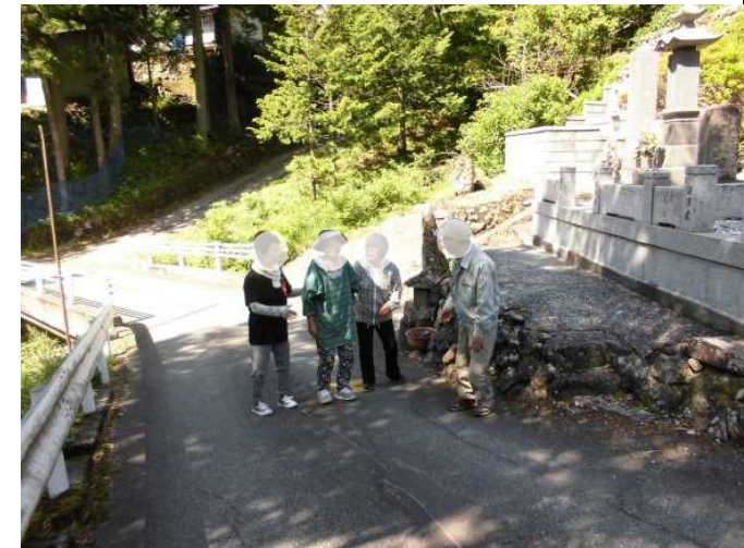
要配慮者の避難誘導訓練