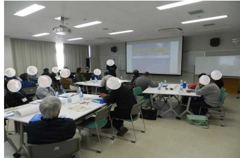
防災マップ作成方法の講義