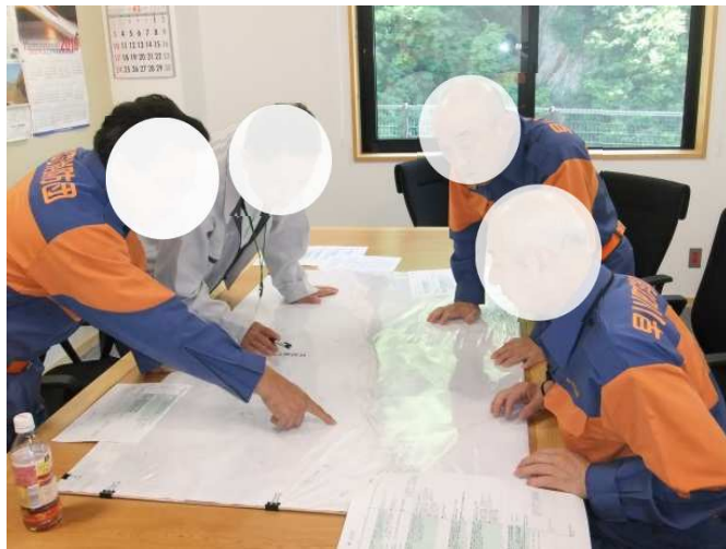
災害対策本部との情報伝達訓練