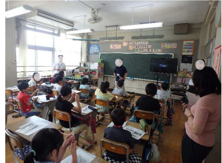
6月22日 峡南建設事務所実施状況