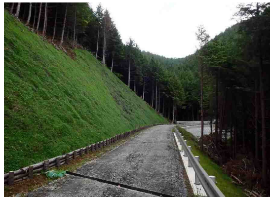
② 林道沿線における森林整備の状況