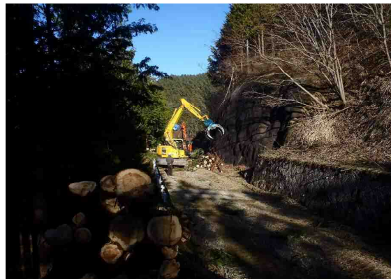
③ 林道沿線における収穫木材の搬出状況