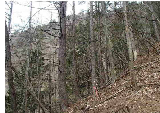
④ 先線計画箇所の現地状況