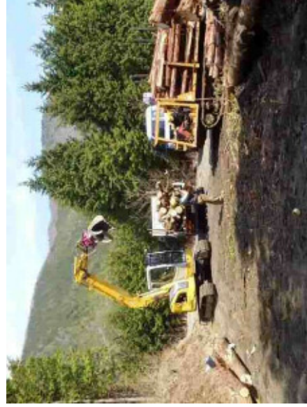
③ 林道沿線における収獲木材の搬出状況