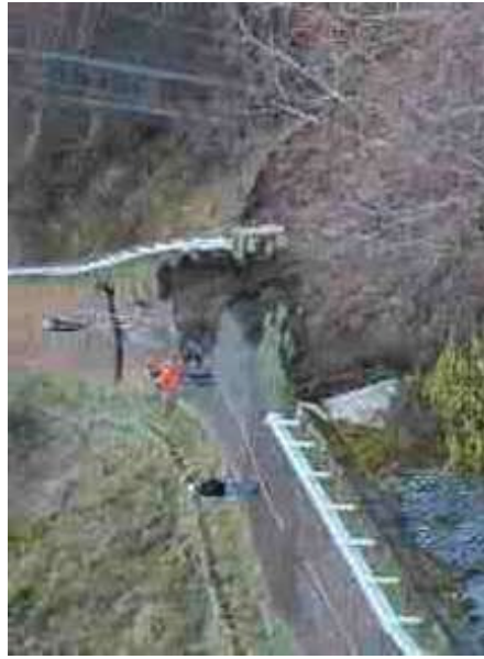
② 平成25年台風18号災害の状況