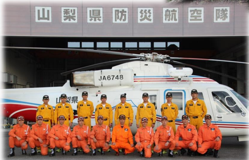
～ 全体集合写真 ～