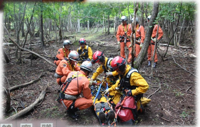
～ 清哲訓練場での訓練風景 ～