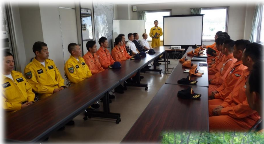
～ 意見交換会 ～

横浜市消防局航空隊及び特別高度救助部隊と大規模災害発生時における連携強化を図ることを目的に合同訓練を実施しました。当隊の機体や資器材の展示、意見交換等を行うとともに、駐機訓練及び実機訓練を実施し、応援時の安全かつ迅速な任務遂行、円滑な連携活動を図るため、相互に理解を深めました。