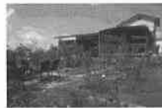
農家レストラン(イメージ)