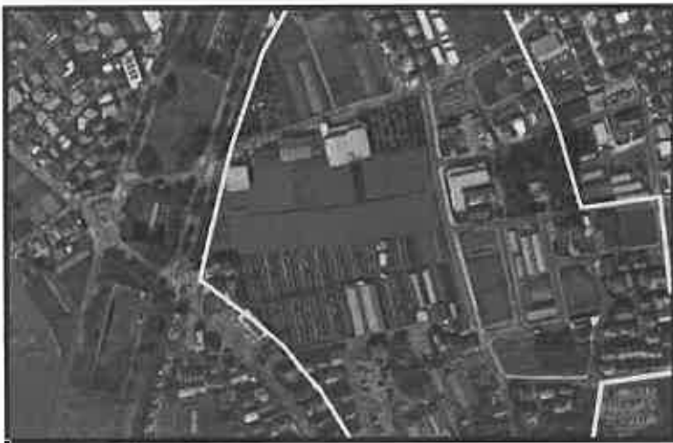
田園住居地域のイメージ