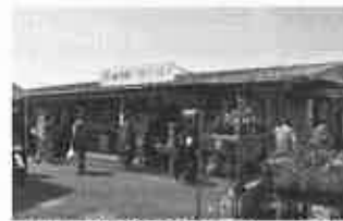
農産物直売所(イメージ)