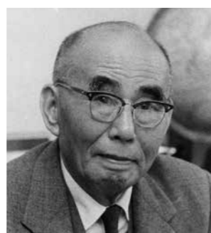
いしばしたんざん 石橋湛山 (1884-1973)

東京都生まれ。幼少期から高校時代を山梨県で過ごした。戦後、衆議院議員となり第一次吉田内閣で大蔵大臣、第一次鳩山内閣では通商産業大臣を務める。1956（昭和31）年こは第55代内閣総理大臣に就任した。