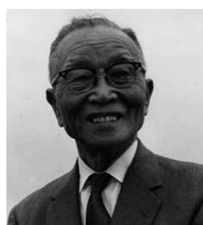
ないこうたちゅう 内藤多伸 (1886-1970)

南アルプス市生まれ。建築構造技術者・学者。東京タワー、大阪通天閣、名古屋テレビ塔など、多くの塔を設計し、「耐震構造の父」「塔博士」と呼ばれた。山梨県庁本館や県民会館の設計も手掛けた。