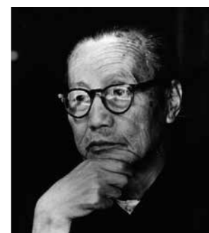
いいだだこつ 飯田蛇笏 (1885-1962)

笛吹市生まれ。近代俳句界を代表する俳人。故郷山梨で数々の格調高い句を詠み多くの人々を魅了した。作家・芥川龍之介とも作品を通して深い交流があった。郷土を詠んだ「芋の露連山影を正しうす」は代表句の一つ。