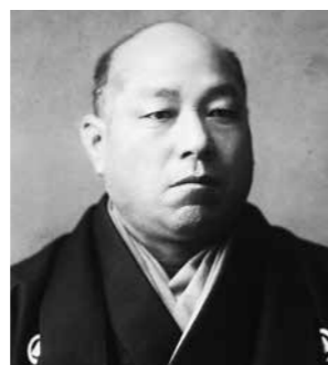
あめみやけいじろう 雨宮敬次郎 (1846-1911)

甲州市生まれ。甲州財閥の一人。明治の文明開化の中で常に時代の先を読み、鉄道や製鉄業などの経営に手腕を振るい、甲武鉄道（現・JR中央線の一部）の取締役となる。また、国の発展のために社会的事業にも取り組んだ。