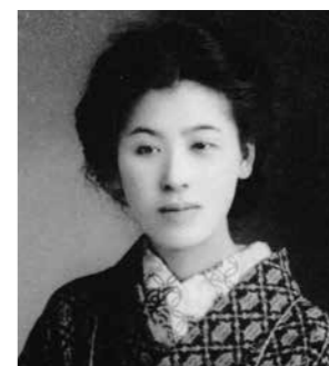
むらおかはなこ 村岡花子 (1893-1968)

甲府市生まれ。モンゴメリの名作を翻訳した『赤毛のアン』など、欧米家庭文学を日本に紹介し、多くの人に夢と希望を与えた。ラジオの子供向けニュース番組に出演したり、童話や随筆、短歌など数多くの作品を世に残すなど、幅広い活動をした。