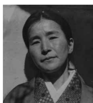
おがわまさこ 小川正子 (1902-1943)

笛吹市生まれ。ハンセン病患者救済に生涯をささげた医師。瀬戸内海に浮かぶ小島のハンセン病療養所「長島愛生園」で7年間を過ごし、体験記『小島の春』を著した。同著は、のちに映画化され大ロングランとなった。