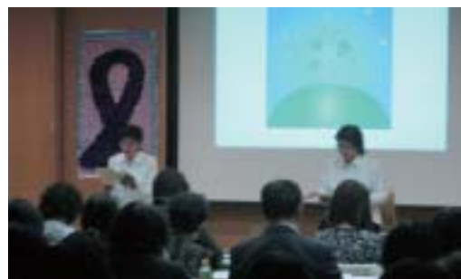
朗読劇「静かな慟哭」～五陰盛苦～