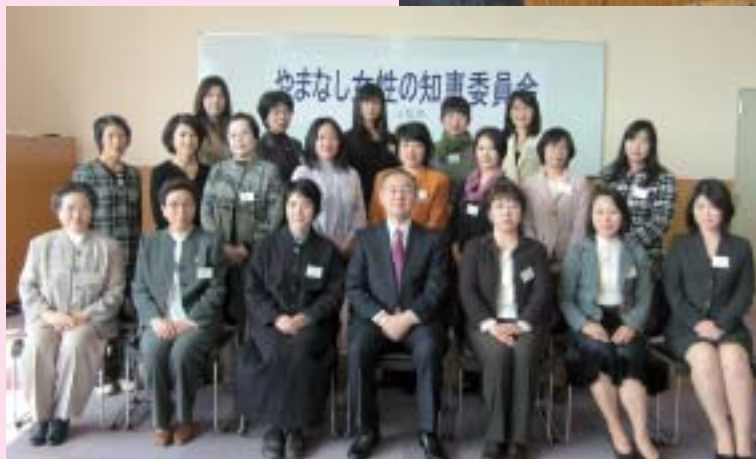
やまなし女性の知恵委員会 (10月27日)