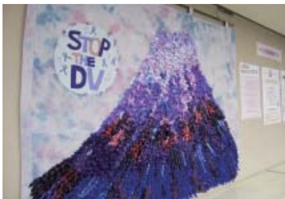
2m×2.4mの大きな富士山。 リボンを貼りつけ手づくりしました。

県は、昨年秋、配偶者からの暴力をなくす運動「広げる・つなげる・結び合うやまなしパープルリボンプロジェクト」を実施しました。