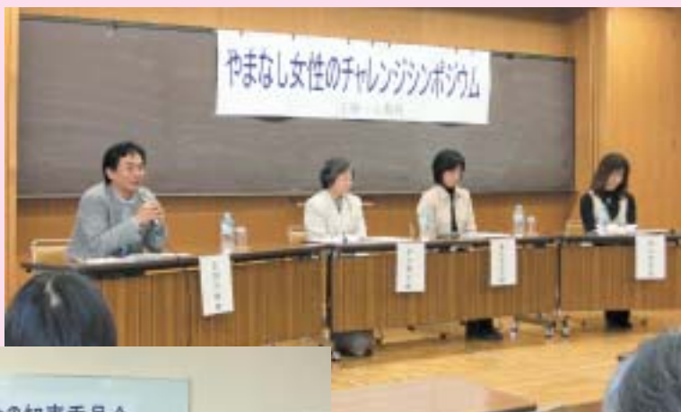
やまなし女性のチャレンジ・シンポジウム (1月30日)