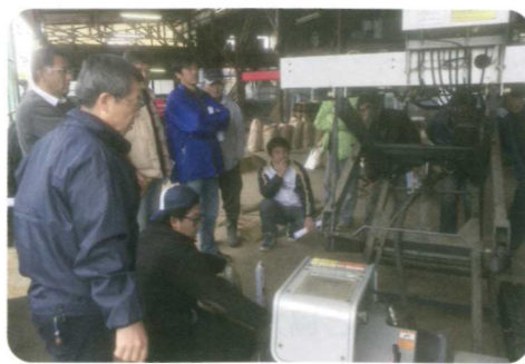
機械点検講習会の様子