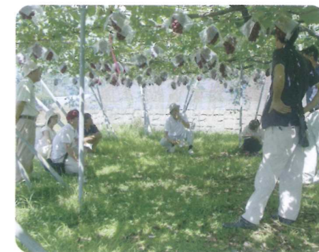
果樹試験場への視察

来年度も展示ほを継続すると共に、退職帰農者や後継者を対象とした栽培の基礎知識についての学習会開催など、地域の担い手を支援する取り組みを行ってまいります。