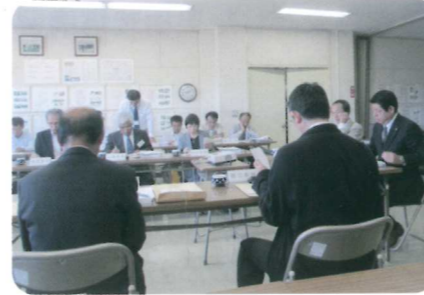
評価委員会の様子