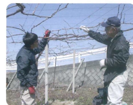
枝の誘引位置を検討(短梢樹への切替)