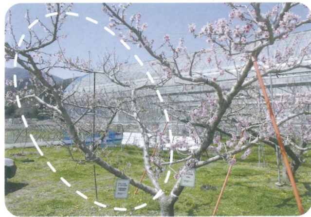
早期着果調節実証樹の状況(左側)

果樹試験場では、平成23年度、26年度の成果情報で、モモの省力化・労力分散技術である「早期着果調節」と「短果枝削減」技術を発表しました。