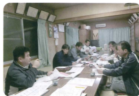
役員による打ち合わせの様子

GAPの取り組みは導入して終わりではなく、改善を行っていくことが重要です。そのため、普及センターではGAP手法の定着を目指し、理解促進、管理基準およびチェックリストの作成・検討などの支援を引き続き行っていきます。