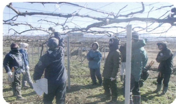
ブドウ剪定講習会

穂坂、大草、新府地区といった韮崎市内の果樹産地では、農家減少による産地衰退を食い止めるため、それぞれ、特徴的な担い手確保対策に取り組んでいます。