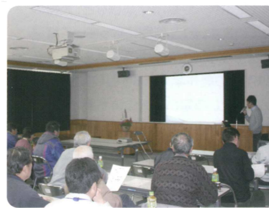
身近な優良事例についての情報交換会

今後も、野菜・花き等の儲かる農業の実現に向け、様々な角度から支援を行って参ります。