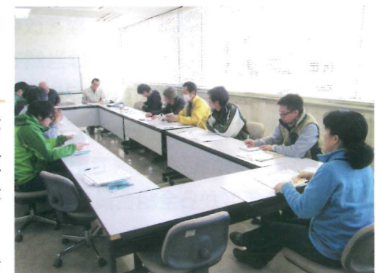
病害虫防除についての研修会