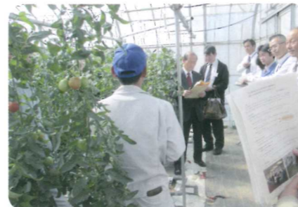
北杜市トマト生産農家を視察

県では、普及活動の成果を的確に把握して、その後の活動に反映させるため、毎年度、普及活動の「内部評価」及び「外部評価」を実施しています。このうち、「外部評価」については、総合技術普及センター、畜産技術普及センター、中北地域普及センター、峡南地域普及センターの普及活動について、平成26年10月14日に7名の評価委員により、総合農業技術センター会議室及び北杜市現地ほ場を会場に行われました。