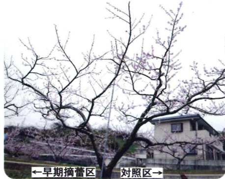
←早期摘蕾区 対照区→ 早期着果調節の実施状況