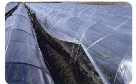
ベテラン農家の換気