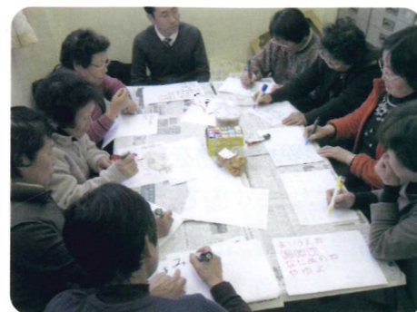
POP作成のために書き方の練習をしています