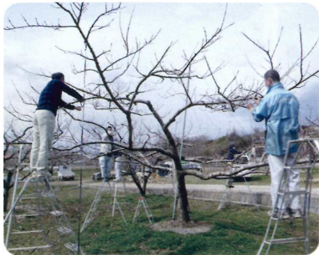
省力化は短果枝削減と摘蕾がポイント

これらの取り組みの結果、技術の周知が図れ、生産者の関心も高まっています。この省力化技術の導入地域の拡大を目指し、普及活動を継続していきます。