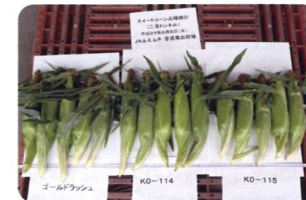
収穫されたスイートコーン