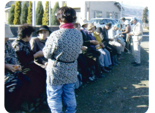
講習会に集まった生産者組織の皆さん (富士川町天神中条地区)