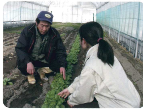
農事組合法人で冬野菜の試作を行いました