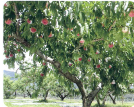
収穫間近の早期摘蕾区の果実の様子