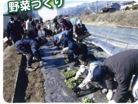
生産者団体の展示ほで、 早春レタスの講習(甲斐市)