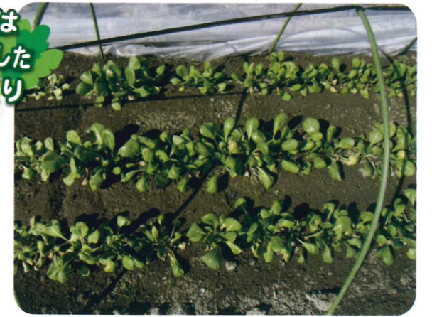
1重トンネルのコマツナ (11月20日播種1月10日撮影)の生育状況