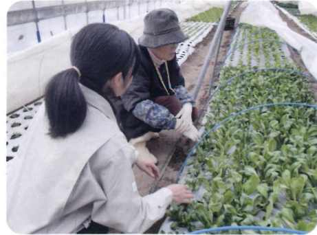
冬野菜の作型や品種を紹介しました。 直売所では大人気との声も

中北地域普及センターでは、一年を通して栽培講習会の開催を支援していますが、近年、冬野菜をテーマにした指導依頼が増えてきました。2~3月の時期は県産野菜が少なくなるため、出荷品目の拡大が求められています。