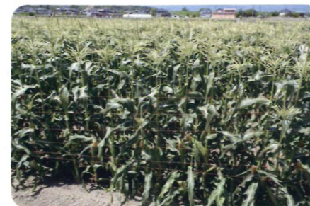
収穫期を迎え大きな実を付けた畑