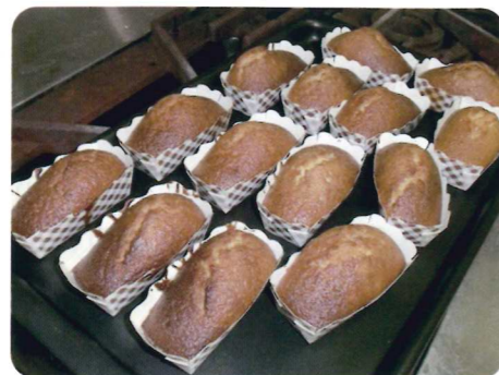
焼き上がった試作マフィン