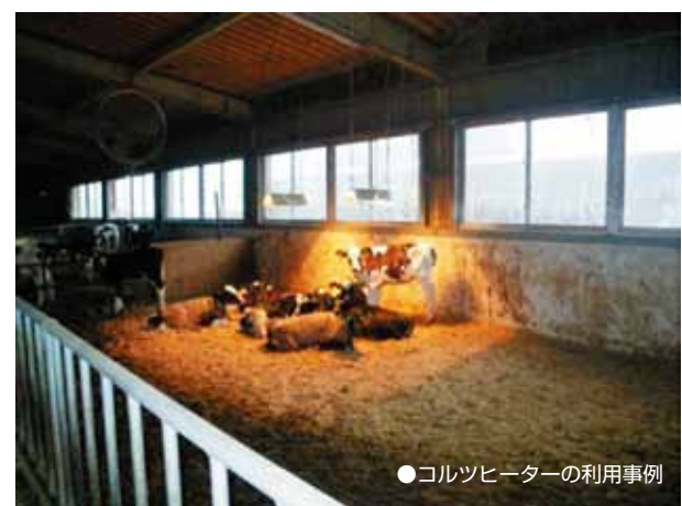
●コルツヒーターの利用事例