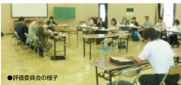
●評価委員会の様子