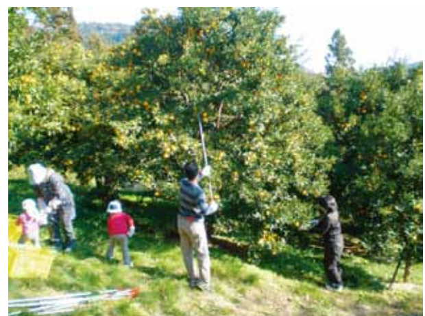
●ゆずの収穫ボランティア

地区の中には、特産のゆずを活用した都市農村交流イベントや、加工品の開発・販売に取り組む団体が複数存在しています。峡南地域普及センターでは、産地の維持や地域活性化に向けてこのような団体の活動支援を行っています。今年度は、ゆずの収穫ボランティアやオーナー制度、加工体験等の交流イベントの実施支援、また、ゆずを用いた新しい加工品の開発支援を行っています。今後も引き続き、交流イベントの拡充や新商品開発に向けた支援を行い、ゆず産地の維持・発展に取り組んでいきたいと思ひます。