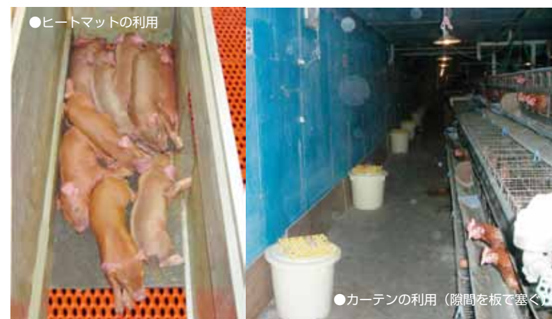
●ヒートマットの利用