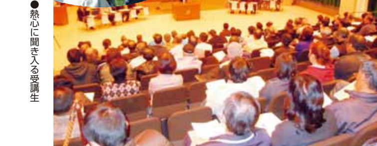
●熱心に聞き入る受講生

11月10日、笛吹市のスコレーセンターにおいて、平成22年笛吹市援農支援センター技術講習会開講式が行われました。この技術講習会は笛吹市の援農支援センターが主催するもので、市内の果樹農家からの労力要請に即応できる人材を育成するため、モモやブドウ等の管理作業についての知識や技術習得をねらいとしています。今回の技術講習会は果樹の剪定で昨年に続き2年目ですが、事前の申込者数は144名と前年の80名を大幅に上回る希望がありました。