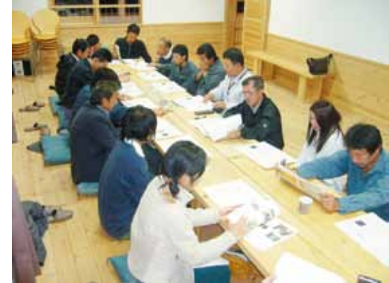
●学習農園での指導