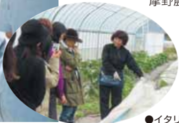
●イタリアン野菜検討会

中北地域普及センター管内においては、今年度本事業を活用し、巨摩野農業協同組合が、南アルプス市産貴陽の産地ブランドの強化を図るため、統一選荷箱や新しい選果方法などの検討・実施に取り組んでいます。