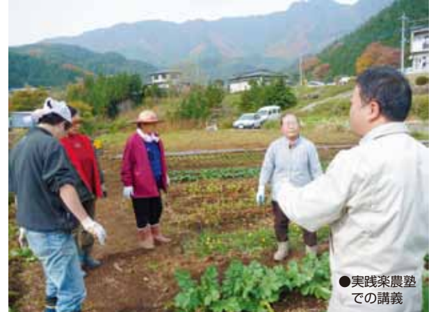
●実践系農塾での講義