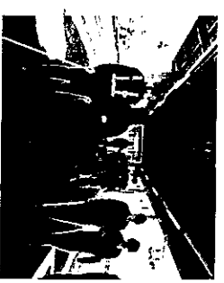
【研修の様子(介助の疑似体験)】