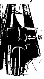
【バリアフリー対応のバリアフリー駅】