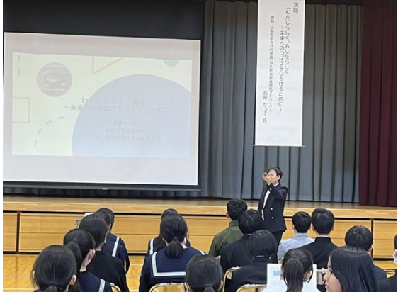
中学生・保護者と