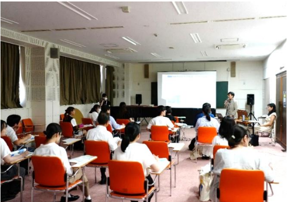
高校生・大学生と