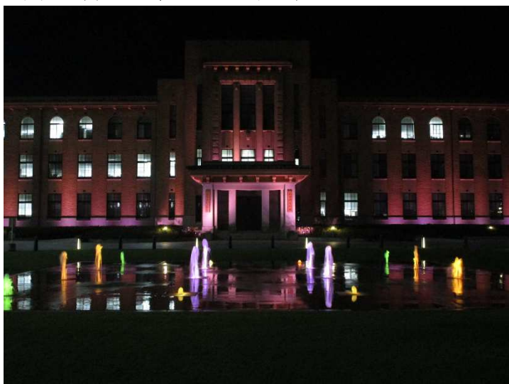
写真3（県庁別館ライトアップ）