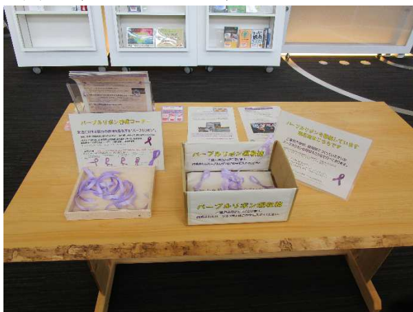
写真1（パープルリボン）