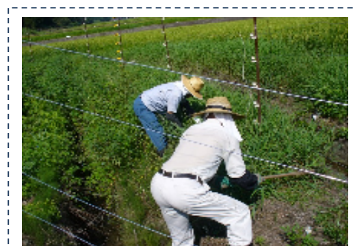
【電気柵の管理状況】