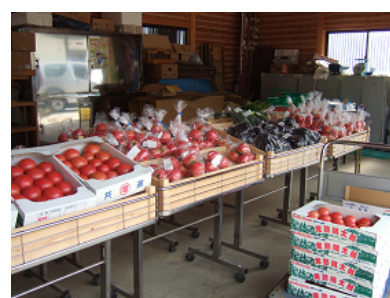
【直売される特産のトマト】