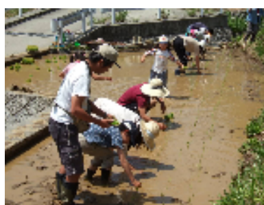
【棚田オーナー制度】