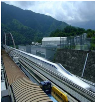
④リニア見学センター付近で整備が進められている農林産物直売所 県内外から観光客の来訪が期待される。