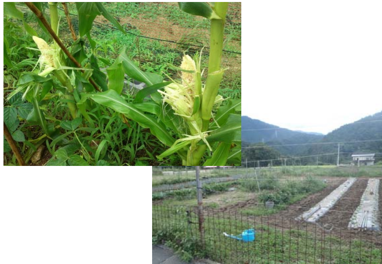
③シカによる被害を受けたトウモロコシ 農家が自作する防止柵では獣害は防ぎ切れない状況である。