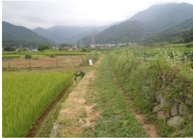
①農道の幅員が狭小で、農作業に支障をきたしている。