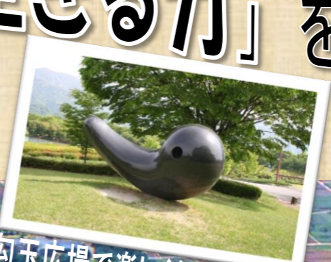
勾玉広場で楽しくお弁当タイム