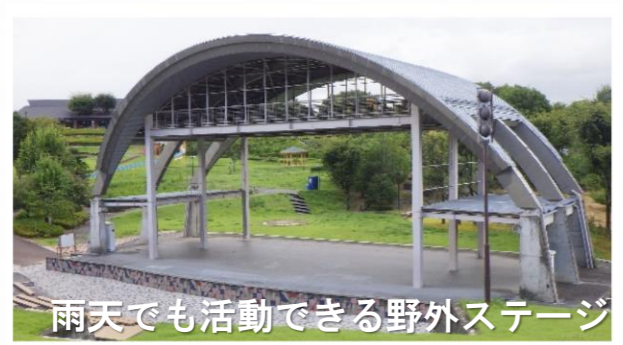
雨天でも活動できる野外ステージ

東日本最大級の前方後円墳や円墳など、実際に上って見たり、ガイドの解説を聞きながらのツアーもできます。