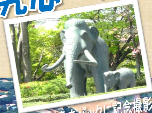
ナウマン象をバックに記念撮影