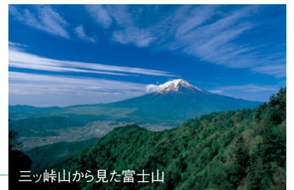
三ツ峠山から見た富士山